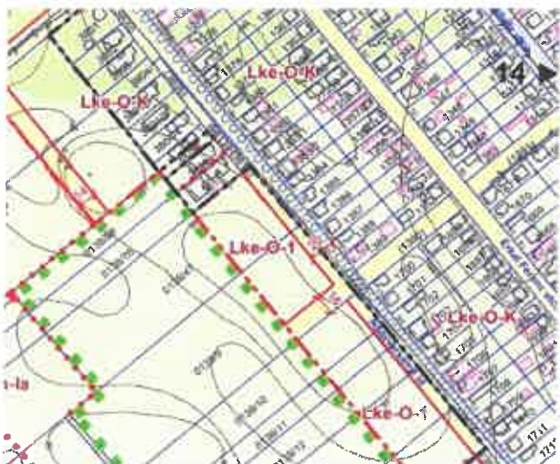
Szabályozási Terv részlete

A kérelem tárgyát képező ingatlanok belterülethez közvetlenül kapcsolódó, Dunavarsány Város Önkormányzata Képviselő-testületének Dunavarsány Építési Szabályzatáról szóló, többször módosított 12/2016. (VI. 10.) önkormányzati rendelete (a továbbiakban: HÉSZ) és annak mellékletét képező Szabályozási Terv (a továbbiakban: SZT) alapján a javasolt belterületi határvonalon belül helyezkedik el, valamint Lke-O-1 jelű kertvárosias lakóövezetben található.