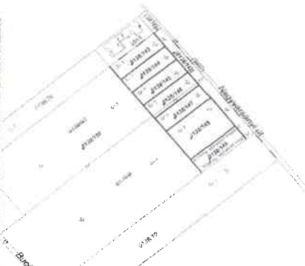
Változási vázrajz részlete

Az ingatlantulajdonosok által korábban kezdeményezett telekalakítási eljárás lezárult, amelynek eredményeként hat darab kivett beépítetlen terület, egy magánút, valamint egy közút került kialakításra. Az érintett ingatlanok közül a 0138/146, 0138/147 és 0138/148 hrsz-ú kivett beépítetlen terület, 0138/149 hrsz-ú kivett közforgalom elől elzárt magánút és 0138/142 hrsz-ú kivett helyi közút más célú hasznosítását engedélyezte (2. számú melléklet) a Pest Vármegyei Kormányhivatal Földhivatali Főosztály, Földhivatali Osztály 10. A kialakított 0138/142 hrsz-ú közút térítésmentesen Dunavarsány Város Önkormányzatának tulajdonába került.