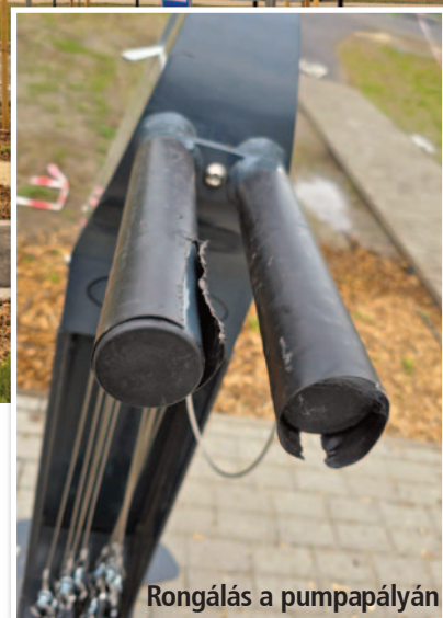
Rongálás a pumpapályán