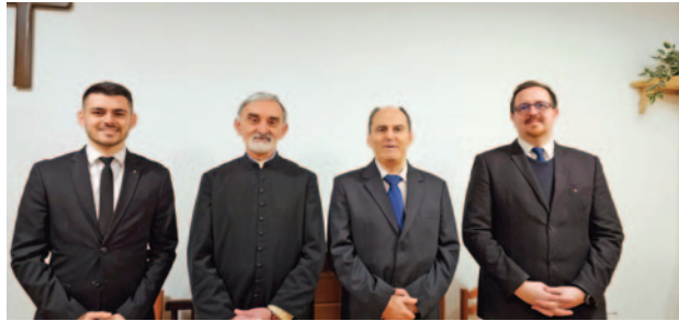
A január 20. és 23. között tartott ökumenikus imahét lekészei Dunavarsányból és Délegyházáról

Ugyanezzel a három betűvel fejezzük ki azt a spirituális, vallásos érzést, amelynek tartalma már meghaladja az idő és tér korlátait, legalábbis alapjaiban, és a transzcendens világhoz fűződő pozitív viszonyunkat fejezi ki. Ennek a legegyszerűbb kérdése így hangzik: Híszel Istenben? És aztán ezer más kérdés fakad ebből: kegyelem, bűnbocsánat, ítélet, pokol, mennyország, halál, halál utáni élet etc. Érdekes lenne az a kutatás, hogy egy közösségben, ha e sornak a folytatását kérnénk, mikor jutnánk el oda, hogy hiszed-e az egyházat? Ha egyáltalán eljutnánk ide, a legtöbb ember azt mondaná, hogy ez nem hit-kérdés, hiszen itt van az utca közepén a templom, ismerem a papot, támogatom vagy nem támogatom, megyek vagy nem megyek, szídom, kritizálom, rágalmozom vagy bízom benne, dicsérve azt másoknak is ajánlom. Ehhez nem kell hit, elég az ismeret és a tapasztalat – mondanák sokan. Élén az egyházzellenes közbeszéd fröcsögésével negatív, és olykor a szívvel-lelket gyógyító, hitet, reményt és szeretete-