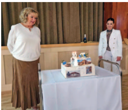
Hivatali búcsúztató szeptemberben