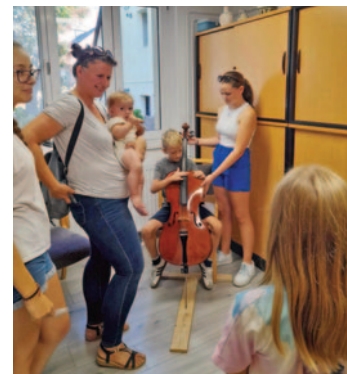
Hangszerválasztó nyílt nap a zeneiskolában szeptember 5-én