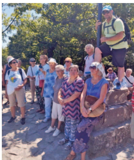
Kirándulás a Pilisben