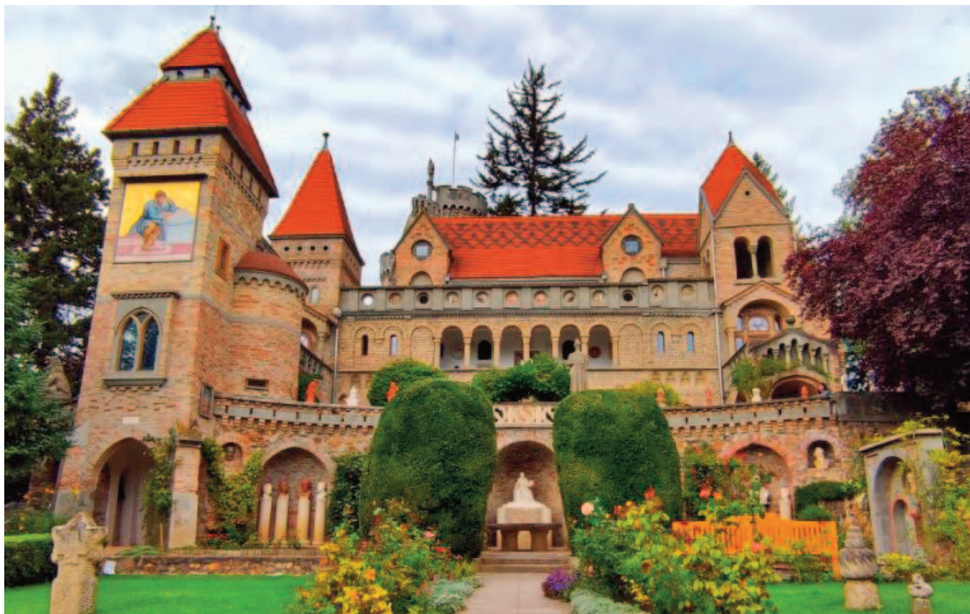
A székesfehérvári Bory-vár

Jelentkezni telefonon lehet: 06/20 938-2774, herendi.peter54@gmail.com , Facebook: Nagyvarsányi Nyugdíjasok