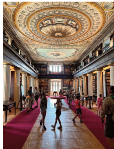
Vasárnapi lelki táplálkozás után és testi táplálkozás előtt