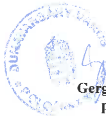
Gergóné Varga Tünde polgármester