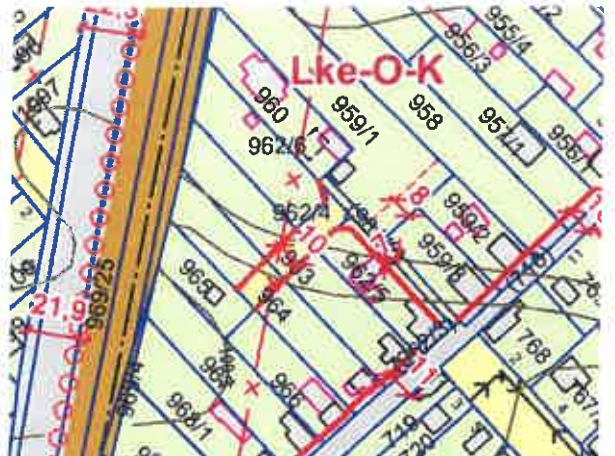
Galagonya utca a Szabadkai utca környezetében

A Dunavarsány, 3202 helyrajzi számú ingatlanon élő lakosoktól több alkalommal érkezett lakossági megkeresés, hogy az egyes szolgáltatók, rendvédelmi és egyéb szervek nehezen vagy egyáltalán nem találják meg őket. A Dunavarsány, 3202 helyrajzi számú ingatlan közötti kapcsolattal – mely a házszámmal történő ellátás feltétele – a Domariba sziget, mint utca felől biztosított, fizikai megközelítése azonban a Dunavarsány, 3030 helyrajzi számú, a Dunavarsány Építési Szabályzatáról szóló, többször módosított 12/2016. (VI. 10.) önkormányzati rendeletben és annak mellékletét képező Szabályozási Tervben helyi közút besorolású, a Ráckevei-Soroksári-Duna-ágba torkolló ingatlan felől került kiépítésre. A Dunavarsány, 3030 helyrajzi számú közút elnevezése a Dunavarsány, 3202 helyrajzi számon kiépült épületek elhelyezkedésének tájékozódását segítheti.