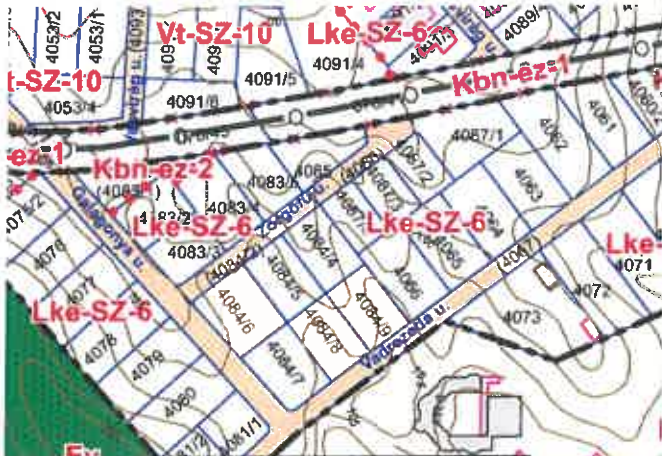
Galagonya utca a Naprózsa lakóparkban