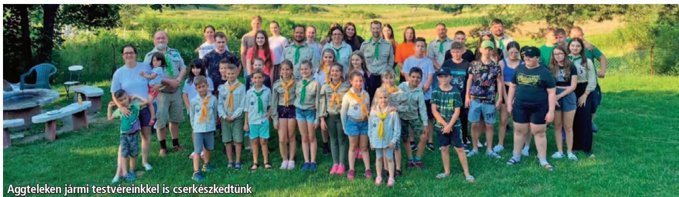
Aggteleken jármi testvéreinkkel is cserkészkedtünk