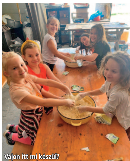
Vajon itt mi készül?