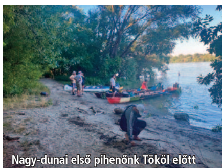
Nagy-dunai első pihenőnk Tököl előtt