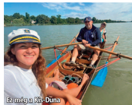
Ez még a Kis-Duna