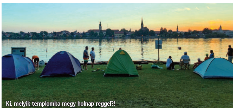
Ki, melyik templomba megy holnap reggel?!