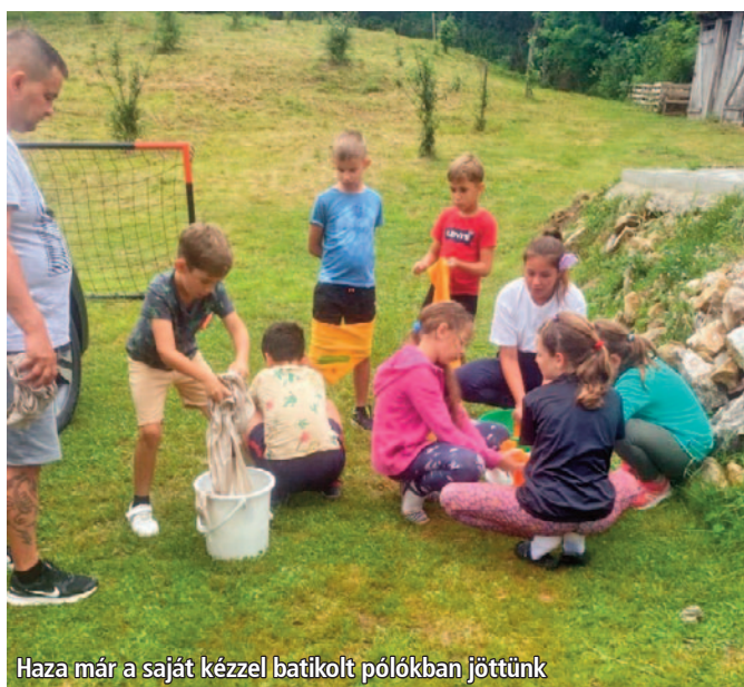
Haza már a saját kézzel batikolt pólókban jöttünk