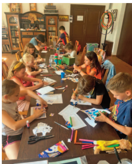
A kreatív hittanóra Dániel történetéről szólt