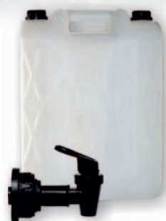
Tündérvíz 20 L /kannatöltés (Adagoló csapos kannákban)