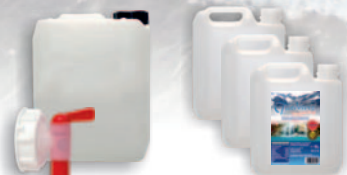
Tündérvíz 10 L (Adagoló csapos kannákban)