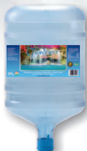
Tündérvíz 19 L /ballontöltés visszaváltható pc ballonban (vízadagoló automatára)

Telefonos, e-mail-es vagy webáruház megrendelés esetén cégünk hétfőtől-péntekig házhoz szállítást is vállal, előre egyeztetett időpontban.