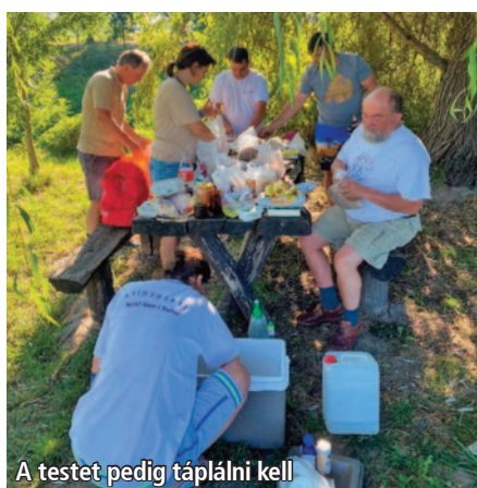
A testet pedig táplálni kell