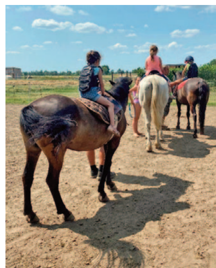
A lovas foglalkozás egyik csúcsa volt a hétnek