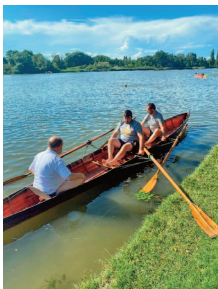
Minden program oktatással és pakolással kezdődik

Az esemény a BGA Alapkezelő támogatásával valósult meg.