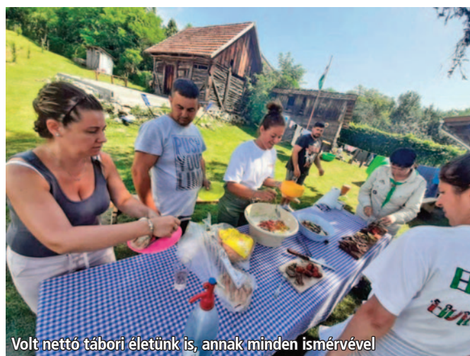
Volt nettó tábori életünk is, annak minden ismérével