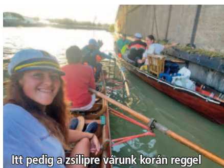
Itt pedig a zsilipre várunk korán reggel