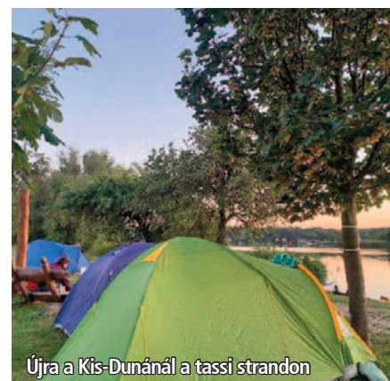
Újra a Kis-Dunánál a tassi strandon