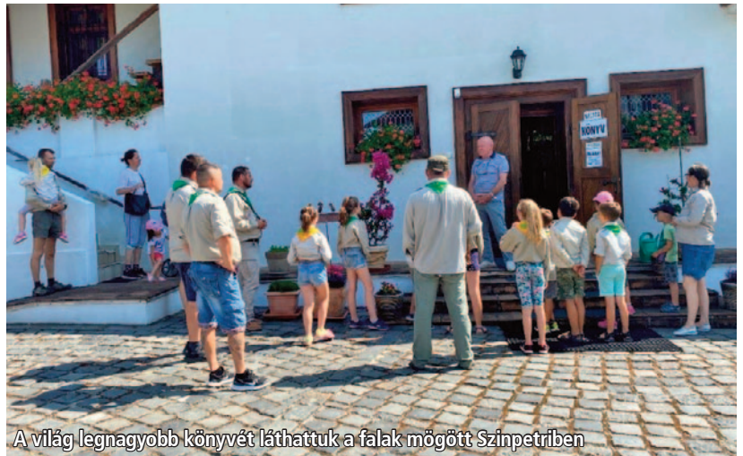
A világ legnagyobb könyvét láthattuk a falak mögött Szinpetriben