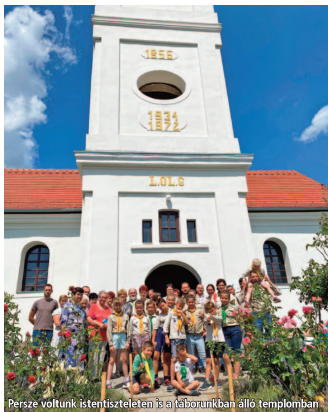
Persze voltunk istentiszteleten is a táborunkban álló templomban