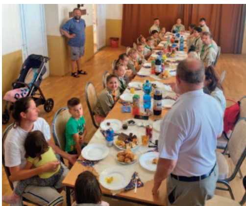
Szalócon gazdag testi és lelki táplálékot is kaptunk. Isten éltesse őket!