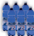
Tündérvíz 1,5 L pet (6 db-os gyűjtőcsomagolásban)

Tündérvíz 5 L /kannatöltés visszaváltható (3 db-os gyűjtőcsomagolásban)