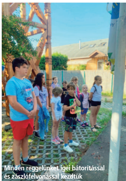
Minden reggelünket igei bátorítással és zászlófelvonással kezdtük

A gazdag programmal, jó hangulattal és persze biblikus szellemiségben lebonyolított táborról az alábbi képes beszámolót osztjuk meg. Teljes beszámolót és további képeket az SDG evangéliumi folyóirat őszi számában olvashatunk.