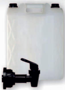
Tündérvíz 10 L (Adagoló csapos kannákban)