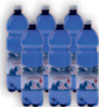
Tündérvíz 1,5 L pet (6 db-os gyűjtőcsomagolásban)