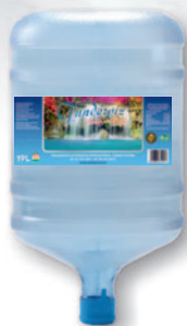
Tündérvíz 19 L /ballontöltés visszaváltható pc ballonban (vízadagoló automatára)

Telefonos, e-mail-es vagy webáruházás megrendelés esetén cégünk hétfőtől-péntekig házhoz szállítást is vállal, előre egyeztetett időpontban.