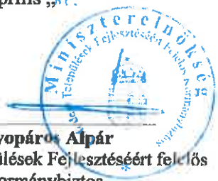
Gyopáros Alpár Modern Települések Fejlesztéséért felelős kormánybiztos