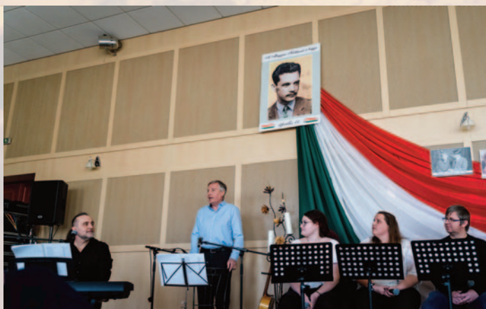
Költészet napi műsor a művelődési házban