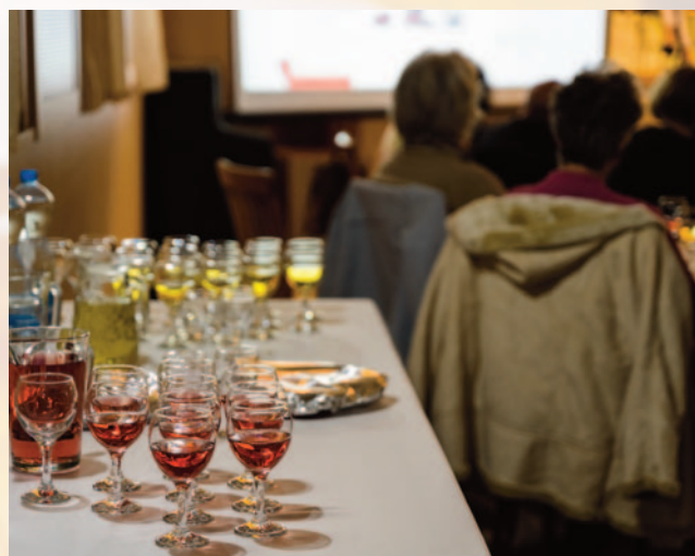
Bor, vers, zene – középpontban Petőfivel