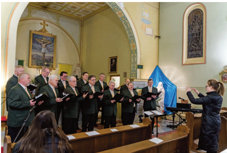
A Kantátika Férfikar adventi hangversenye a kisvársányi katolikus templomban