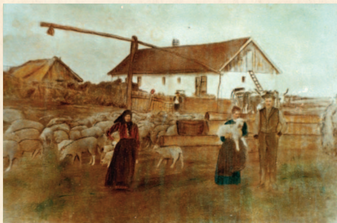
Régi fénykép Bathóék tanyájáról és a Kutyakaparóról