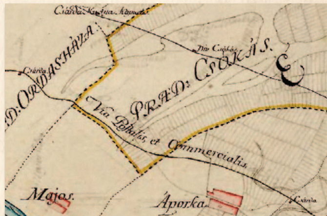
Az 1793-as térképen balra fent: „Csárda Kutyakaparási” felirat