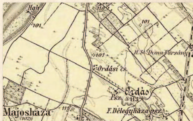
F. Délegyháza psz. felirat p betűje alatt a 3. katonai felmérésen