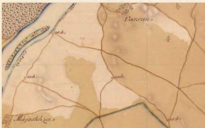
W.h. (útkaparóház) jelöléssel középen az 1. katonai felmérésen