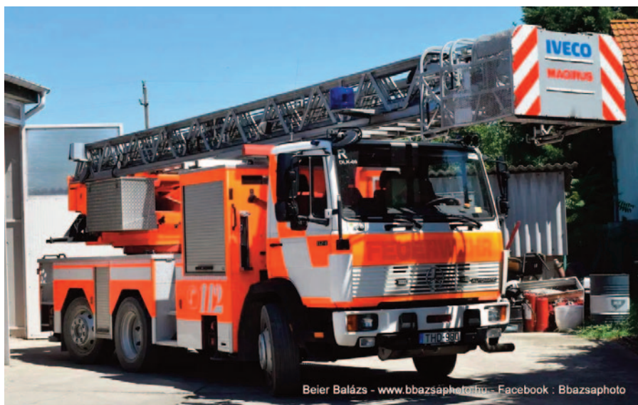
Beier Balázs - www.bbzsaphoto.hu - Facebook : Bbzsaphoto

A régi létra megjavítása már nem volt gazdaságos, ezért egy új magasból mentő megvásárlásához kértek támogatást a délegyházi önkormányzattól. A mintegy 9 millió forint költséget teljes egészében a helyi önkormányzat fizette, ezáltal egy 1996-os gyártású, a korábbinál 18 évvel fiatalabb eszközzel menthetnek a jövőben a Délegyházi-Dunavarsányi Önkéntes Tűzoltó Egyesület munkatársai.