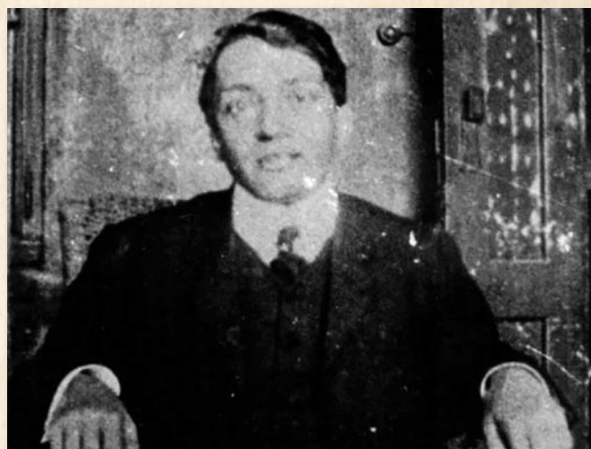
Ady a kúria egyik szobájában 1907