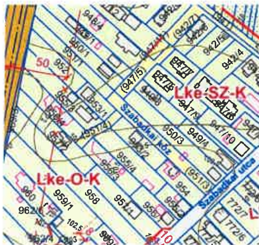
Szabályozási Terv részlete

A fentiek alapján tehát a 950/1 hrsz-ú ingatlan megközelíthető önkormányzati tulajdonú kivett helyi közútról, így az ingatlant terhelő útszolgalmi jog okafogyottá vált. Az Önkormányzat megállapodás (4. sz. melléklet) keretében tudja a Földhivatalnál törölni az útszolgalmi jogot.