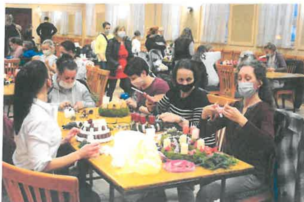
Adventi koszorúkészítés, advent 1. vasárnapja

8. Olvasásra, könyvtárhasználatra nevelés: Könyvtárunk fő feladata az olvasók és látogatók teljes körű kiszolgálása, dokumentumok szolgáltatása. Könyvkölcsönzés, könyvtárak közötti kapcsolat fejlesztése, tájékoztatás, irodalomkutatás, adatgyűjtés, könyv-és egyéb dokumentum