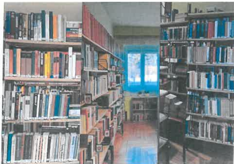
A könyvtár rendezése folyamatban...