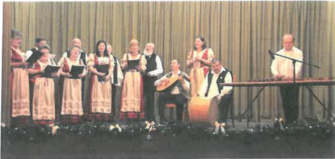
Dunavarsányi Népdalkör és Citeraegyüttes

7. Helyi hagyományok ápolása, hagyományörző/teremtő és művészeti tevékenység támogatása: Advent időszakában civil szervezeteink és saját csoportjaink aktív közreműködésével színes programok, meghitt rendezvények valósultak meg, illetve már hagyományt teremtettünk a Mikulás-járással, amelynek következtében több száz dunavarsányi kisgyermek találkozhatott élőben a Mikulással és gazdagodhatott ajándékokkal a sok-sok helyi vállalkozó és magán ember által felajánlott adományozások révén.