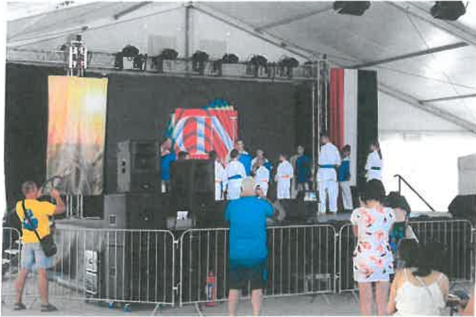
mobil kordon kerítés

költségvetése biztosította és ezek hatékony felhasználását a Képviselő-testület felügyelte. A megvalósult bevételeket a saját bevételek, (belépődíjas rendezvények, terembér stb.) és a költségvetésből kapott támogatás biztosította. 2021-ben az önkormányzati költségvetésen felül állami támogatással illetve pályázati pénzzel is sikerült növelni bevételeinket, amit nem csak rendezvényeinkre fordítottunk, de tárgyi eszköztárunkat is szépen tudtuk bővíteni. Többek között pályázati pénzből vásároltunk a nagy rendezvényekhez elengedhetetlen: 50 méter kordon kerítést, 40 garnitúra sörpadot, 2 db kisebb méretű sátor, 1 db 8x20 méteres rendezvény sátor.