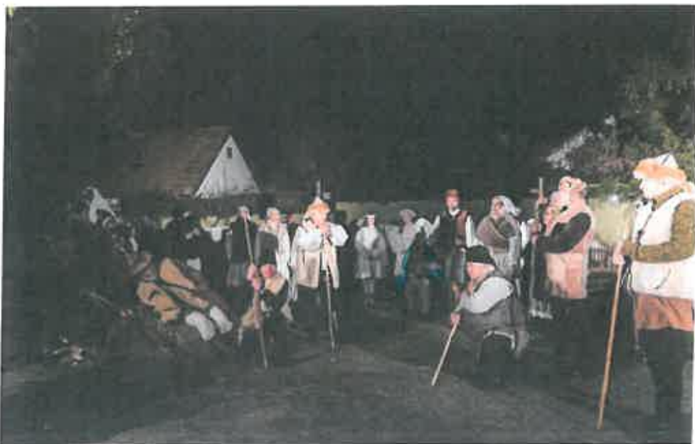
Kalamajka Néptáncsoport, Betlehemi műsor, Városi karácsony 2021

A Kalamajka Néptáncsoport közreműködésével megvalósult Márton napon egy táncház, illetve szintén a néptáncsoport gazdagította az Adventi programot egy kimagasló színvonalú Betlehemes műsorral.