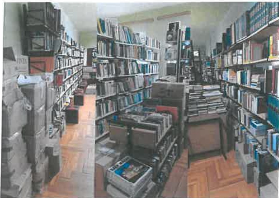
Könyvtár rendezés kezdete...

A dokumentumok beszerzése intézményi költségvetésből és ajándékozásból történt. 2021-re már elavult a könyvtár polcrendszere, zsúfolt, nehezen hozzáférhetőek lettek a kiadványok, nincs elérhető online kapcsolat a használókkal. Már 2021-ben elkezdtük a könyvtár korszerűsítését, nagy hangsúlyt fektetve annak digitalizációjára.