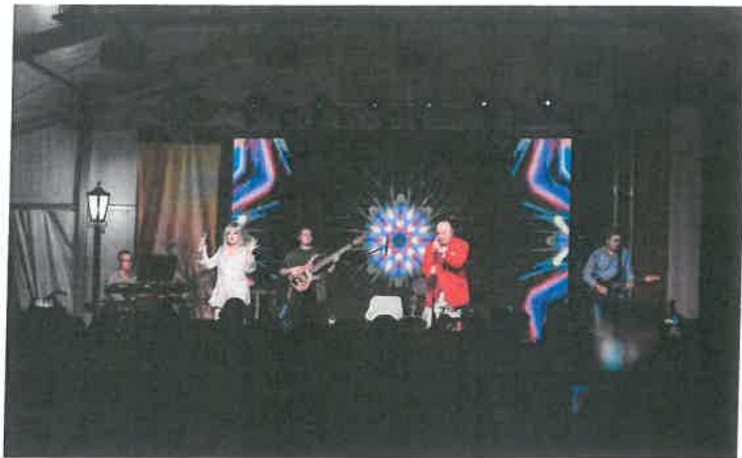
Dunavarsányi Napok 2021

6. Kapcsolat az önszerveződő civil szervezetekkel: Az Intézményünk - mint befogadó intézmény - teret, lehetőséget biztosított a rendkívül sokrétű civil szervezetek részére. Segítette munkájukat, programjaikat, szakmai és pályázati lehetőségeiket figyelemmel kísérte. Fontos szerepük és helyük van nemcsak a városunk életében, de országosan is. Jelentős szerepük van a közösségi kohézió és a magyar kulturális örökség értő ápolásában, a varsányi állampolgárok közéletbe történő bekapcsolásában, a közösségi programok szervezésében.