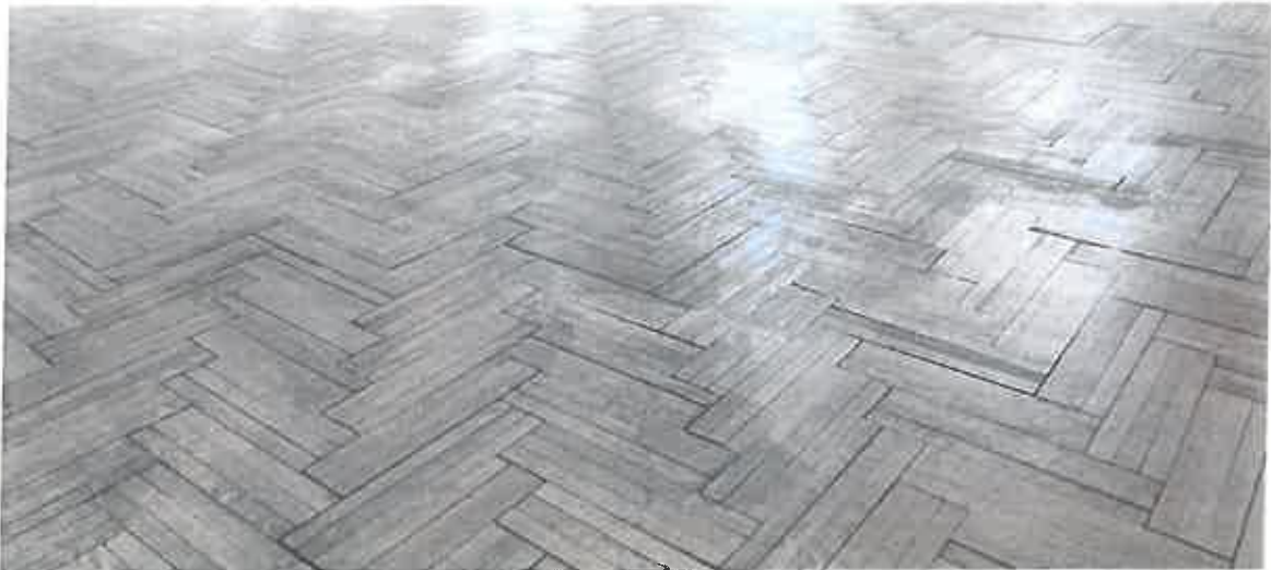
színházterem, kopott parketta

munkákhoz szakember segítséget a Városgazdálkodási Kft munkatársaitól kaptunk. Nagyon fontosnak érezzük, hogy tiszta, szép környezetet nyújtsunk látogatóinknak! Tudjuk, csak úgy lehetünk versenyképesek, ha tereink, eszközeink is fejlődnek és korszerűen szolgálják városunk lakóinak komplex kulturális fejlődését, életesélyeik növelését. A vírus okozta bezárás ideje alatt igyekeztünk mi magunk megoldani a kisebb belső felújításokat, tisztasági festést, falak lambériázását stb. Ám ami nem tűr halasztást, az a nagyterem padlózatának felújítása. A parketta nagyon csúnya, megkopott állapotú, ami nem utolsó sorban esztétikailag nagyban befolyásolja a terem összképét. Az épület lábázatának felújítása is elengedhetetlen. A vakolat lehullott több helyen is, egy időálló burkolati réteggel szükséges azt ellátni.