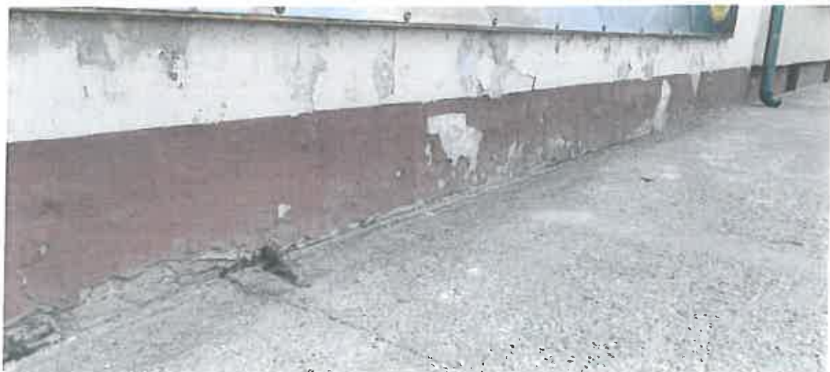
épület lábázat, lehullott vakolat