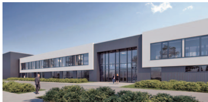
Körforgásos csomagolóanyag-gyár érkezik Dunavarsányba

A Dunavarsányi Ipari Parkban jelenleg épülő üzeme mellett a Dunapack Packaging több telephellyel is rendelkezik Magyarország-szerte: Csepelen, Nyíregyházán és Dunaújvárosban is gyártanak hullámlemez-ből (köznapin néven hullámkarton) csomagolóanyagot, 90%-ban újrahasznosított hulladék-papírból. A most épülő üzem a legmodernebb és „legzöldebb” üzeme is lesz a vállalatnak. Élelmiszer, ital, zöldség- és gyümölcsrekeszként vagy éppen műszaki termékek doboz-ként is találkozhatunk a Dunapack gyárában készült termékekkel. Érdeklőség, hogy ugyan a vállalat fő profilja a csomagolóanyagok gyártása, de emellett kartonból készült székek, vagy éppen praktikus irodai kiegészítők gyártására is képesek, kizárólag hulladék-papír újrahasznosításával.