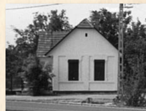
A Széchenyi u. 2. sz. Gallé-ház. Az utcát az idős lakosok ma is Gallé utcájának hívják