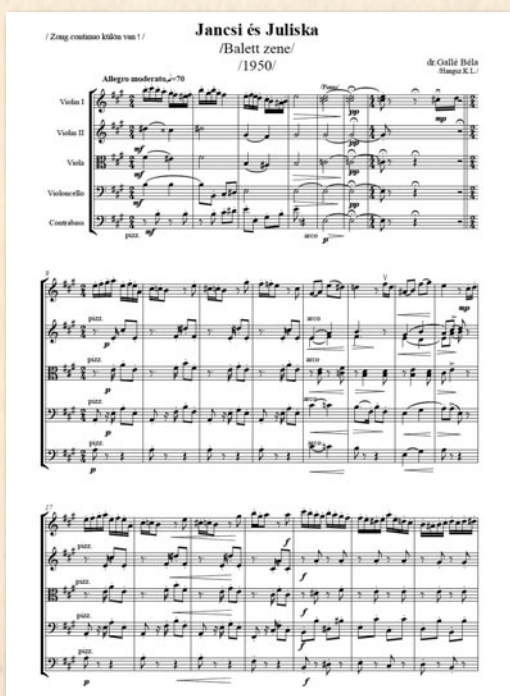
A Jancsi és Juliska kottájának első oldala