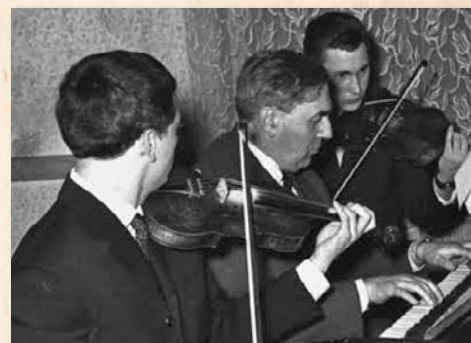
Trió két ifjú hegedűssel