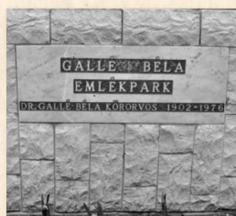
Az emlékpark és játszótér előtti emléktábla