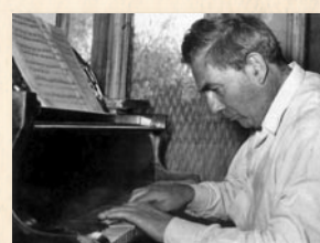
Próba előadás előtt