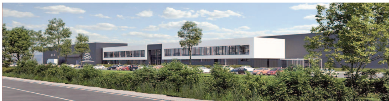
Európa egyik legmodernebb csomagolóanyag gyára épül

A Dunapack Packaging, mint a Prinzhorn Csoport leányvállalata 1990 óta van jelen Magyarországon. Az osztrák, napjainkban is családi tulajdonban lévő csoport három üzletágból áll, és már számos zöld beruházással fejlesztette magyarországi üzemeit, melyek egy különleges, körforgásos gazdasági modellben működnek. Ennek lényege, hogy a termékek nyersanyagai addig maradjanak a gazdasági körforgásban, amíg csak lehetséges, ezzel is óvva a környezetet. A körforgásos lánc a Hamburger Recycling Hungary-vel indul, aki begyűjti a papírt és más, hasznosítható másodlagos nyersanyagokat. Ezek az anyagok aztán a Hamburger Hungáriához kerülnek, ahol magas minőségű hullám-alappapírt állítanak elő belőlük. Ez kerül aztán a Dunapack-hoz, ahol csomagolóanyagok készülnek belőle.