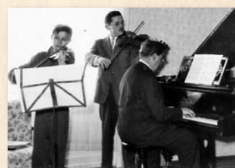
Három nemzedék összhangja