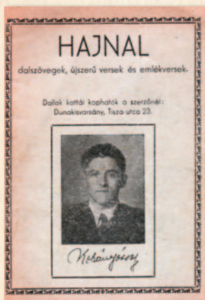
A „Hajnal” c. verses- füzet 1946-ból