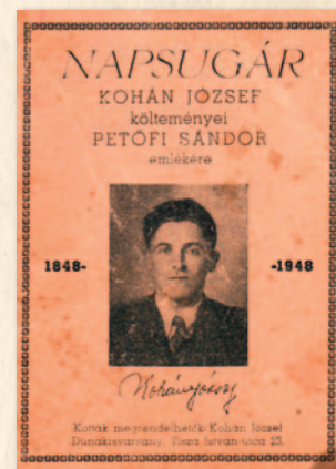
A „Napsugár” c. verses- füzet 1948-ból