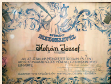
Gyémánt díszoklevél neves nótaszerzők aláírásával