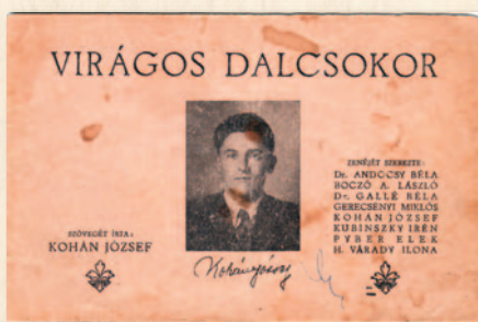
A „Virágos dalcsozor” c. nótásfüzet 1945-ből