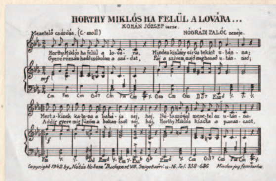
A „Horthy Miklós ha felül a lovára” c. csárdás kottája