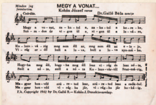
A „Megy a vonat...” c. nótákottája levelezőlapon