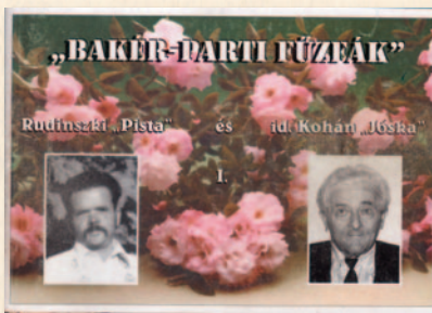
A „Bakér-parti fűzfák” c. nótásfüzet 2000-ból