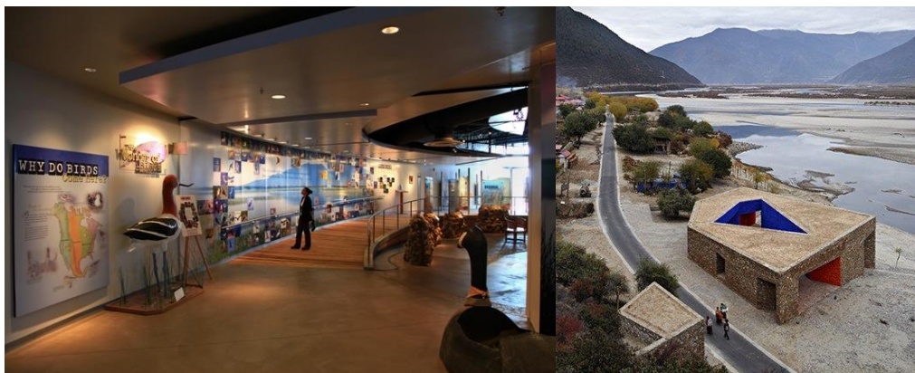
Folyóparti látogatóközpontok előképei

Tájrehabilitáció (degradált, átalakított élőhelyek természeti adottságainak helyreállítása) nem csak bányatavak esetében releváns turisztikai szempontból, a város területén. A helyreállítás alapvető szerepe, hogy az egykor volt természeti-táji adottságok, használati hagyományok és tájkép visszahozásával a település számára valóban autentikus, identitástudatot is fokozó, karakteres tájrészleteket hozzon létre. Ezek a tájrészletek kedvezőbb környezeti állapotba kerülnek, hosszabb távon is fenntarthatóak, tudományos és oktatási célokat tudnak szolgálni, és a város ökoturisztikai fejlesztéseihez elengedhetetlenek. Ilyen lehetséges a mellékág rehabilitációjával (több település összefogása révén), illetve egyes szántókon. Utóbbi esetében egyszerre kezelhető lenne a belvizek okozta probléma is, a kialakítható vizes élőhely(ek) mellé pedig oktató-bemutató ház, a környezeti nevelés és a természetvédelmi bemutatás infrastruktúrájának is kapcsolható.