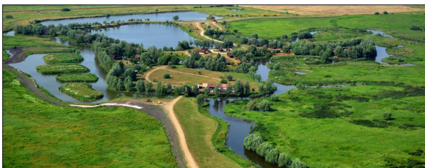
A szécsényi Robinson Parkban az a tórendszer egyediségét az alaktani jellemzők, szigetek adják elsődlegesen, a kis területű (3,5 ha) vízfelület vonzerejéhez a szolgáltatások is jelentősen hozzájárulnak

Az élmény- és kalandparkok szintén népszerű, látogatott helyszínek, akár tavak adottságait kihasználva is megjelennek a kínálatban. Egyes tavaknál néhány élményelem színesíti a programlehetőségeket, mint pl. a zalakarosi termáلتó melletti vizes játszótér (tipegőkövek) esetében. Számos, újjépítésű játszótérnél használták ki a víz, vízi élővilág szimbólumait tematikus tartalmi elemek megfogalmazásakor, továbbá egyre népszerűbbek a vizes játszótérek. Ezek a lehetőségek tavak partján még autentikusabbak, több lehetőséget kínálnak. Az élmény, a 100%-os jelenlét, megtapasztalás, minél több érzékszerv részvétele egyre fontosabb trend a rekreációs lehetőségek kialakítása során, nem csak a gyermekek tekintetében. Az élmény biztosítása