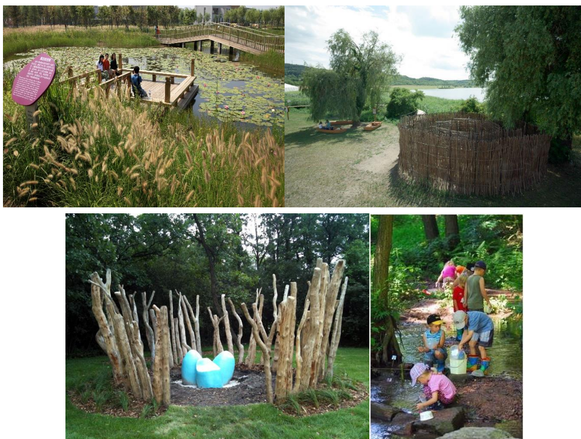
A természeti értékekre alapozott élmény és vonzerő egyedi dizájnnal is jelentősen fokozható

Tájrehabilitáció (degradált, átalakított élőhelyek természeti adottságainak helyreállítása) nem csak bányatavak esetében releváns turisztikai szempontból, a város területén. A helyreállítás alapvető szerepe, hogy az egykor volt természeti-táji adottságok, használati hagyományok és tájkép visszahozásával a település számára valóban autentikus, identitástudatot is fokozó, karakteres tájrészleteket hozzon létre. Ezek a tájrészletek kedvezőbb környezeti állapotba kerülnek, hosszabb távon is fenntarthatóak, tudományos és oktatási célokat tudnak szolgálni, és a város ökoturisztikai fejlesztéseihez elengedhetetlenek. Ilyen lehetséges a mellékág rehabilitációjával (több település összefogása révén), illetve egyes szántókon. Utóbbi esetében egyszerre kezelhető lenne a belvizek okozta probléma is, a kialakítható vizes élőhely(ek) mellé pedig oktató-bemutató ház, a környezeti nevelés és a természetvédelmi bemutatás infrastruktúrájának is kapcsolható.