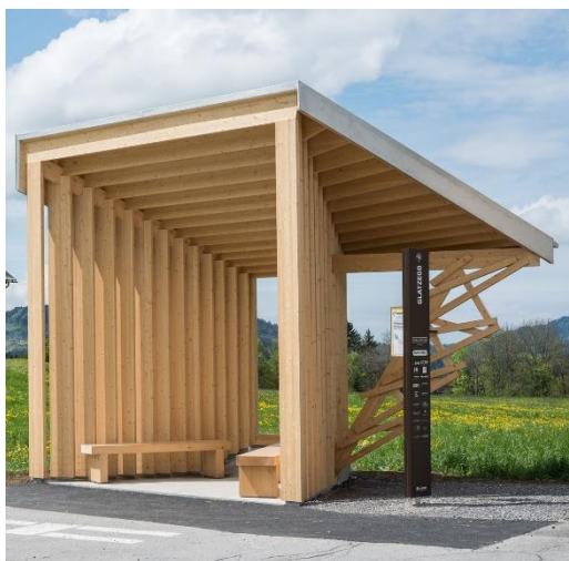
Beszélgető sarok előképe

A helyi közösségi élet új színtereit jelenthetik és a belterületnek karaktert adhatnak az egyedi tervezésű „ beszélgetős sarkok ”. Ezek kis helyigénnyel kialakítható, több ponton elhelyezett fedett-nyitott városi találkozóhelyek, melyek fel vannak szerelve utcabútorokkal, szabadtéri helytörténeti ismertető anyagokkal.