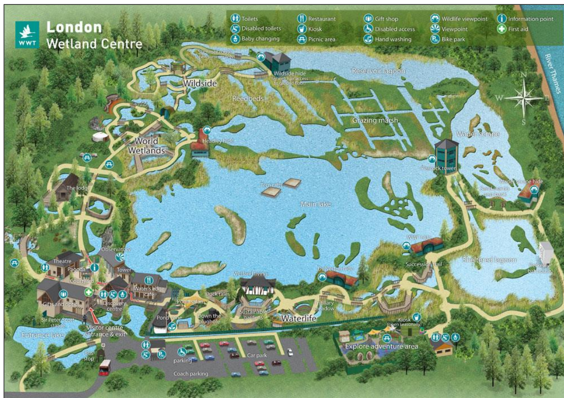
A londoni „wetland-park” látványterképe