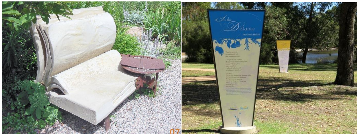
Költészeti témájú part előképei

Külön is javasoljuk olyan közterületek kialakítását, amelyek egyaránt tekinthetőek vonzástényezőnek, szabadidős célpontnak és rendezvényhelyszínnek. Ezek elsősorban olyan zöldfelületi fejlesztések, melyek a jelenlegi funkcionális hiányosságokat enyhítik, továbbá a településcharaktert is erősíteni tudják. Javasoljuk a helyi hagyományokra építve egy „ Ady-park ” kialakítását, amely speciális berendezése, környezetarchitektúrája révén kultéri múzeumként is funkcionál, és alkalmas kulturális rendezvények (pl. koncertek) megtartására is.