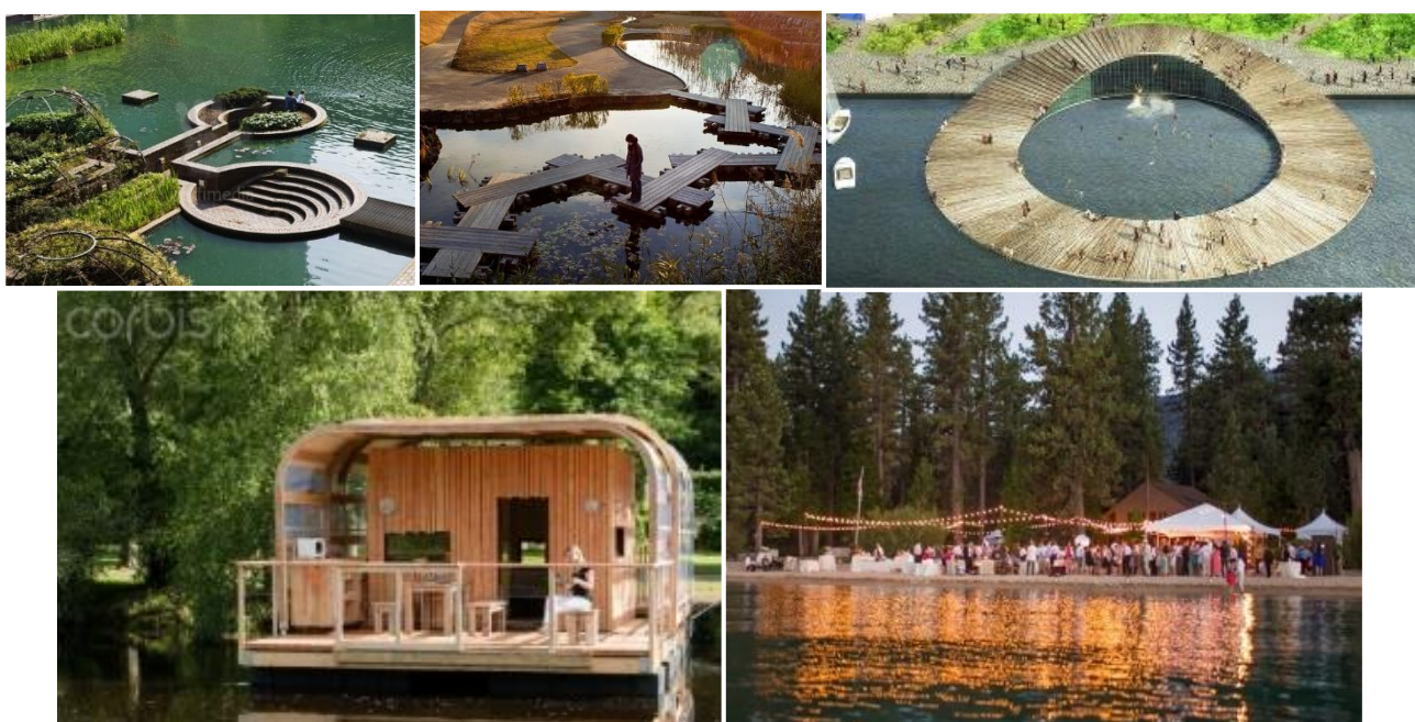
Markáns építészeti karakterű, rendezvény- és rekreációs helyszínt jelentő tájlemek előképei

A másik természeti adottság, amely potenciális vonzástényezőt jelent Dunavarsányon: a Duna, Duna-part. Az adottságok ismeretében javasolható egy ökoturisztikai fogadóközpont, bemutató épület elhelyeztetése a Domariba-szigeten . Ebben az esetben egy olyan létesítmény-együttes képzelhető el, amely a települési-regionális természeti értékeket in-situ módon mutatja be, egy pontszerű vonzástényezőt eredményezve. Ez a fejlesztés az érzékeny természeti értékek védelmét is szavatolja, ugyanakkor azok vonzereje is hasznosulni tud. A bemutatóközponttal kapcsolható étterem, kilátó, hajóház, kikötőhely illetve egyéb, vízisportolást és ökoturizmust támogató szolgáltatás (pl. kajakbérleti lehetőség, szakvezetés).