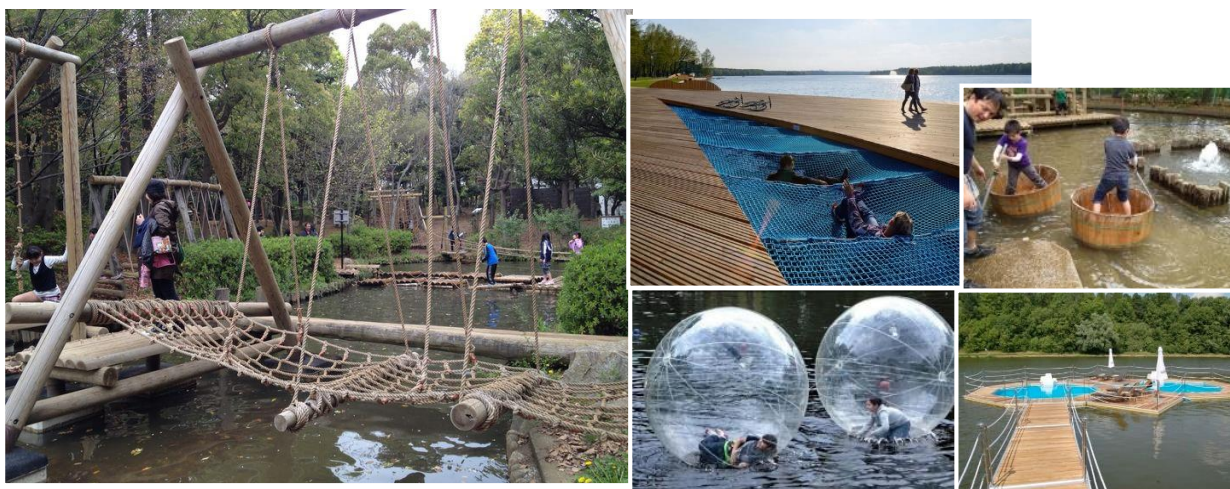
Állóvizekre telepített kalandparkok előképei