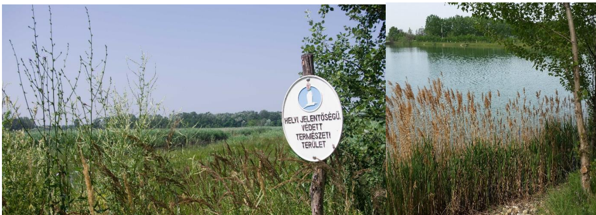
A vonzástényezők részben természeti tájelemekhez kapcsolódnak

A felsorolt természeti értékek közül a legjelentősebbnek az Duna-menti élőhelyek tekinthetők (Domaribasziget, úszólápok), ennek távlati feltárásakor azonban számolni kell a speciális elhelyezkedéssel / megközelíthetőséggel és az érzékenységgel. A további – helyi jelentőségű – vizes élőhelyek szintén alkalmasak lehetnek kis forgalmú, alacsony terheléssel járó ökoturisztikai hasznosításra. A gyepfoltok azért is említést érdemelnek, mivel ezek a hagyományos tájhasználat és korábbi, természetközeli élőhelyek maradványai, tipikus, tájegységre jellemző – ezáltal potenciális vonzástényezőt jelentő – területek. A bányászat során kialakult tavak jelentős turisztikai potenciált jelentenek. Jelenleg is több kínál már szolgáltatásokat (horgászat, vízisportok): pl. Farmer-tó, Aranypikkely horgásztó, Moby Dick horgásztó, Waterworld Park, Rukkel-tó Waterpark. A kultúrtörténeti értékek (pl. Kisvarsányi Szent Kereszt felmagasztalás templom, Nagyvarsányi Szent Vendel templom, Dunavarsány-Délegyházai Társegyházközség templom, XXIII. János pápa szobor) jellemzően helyi jelentőségűek. Az egyéb táji értékek között említhetők a kedvező tájképi adottságok. Tájképi értékeket elsősorban a természeti értéket hordozó tájrészletek jelentenek. Másodsorban tájképi szempontból meghatározó a bányatavak vízfelületének látványa, illetve az 51. sz. főúttól nyugatra eső mezőgazdasági területek látványa, háttérben az RSD-t kísérő galériaerdőkkel.