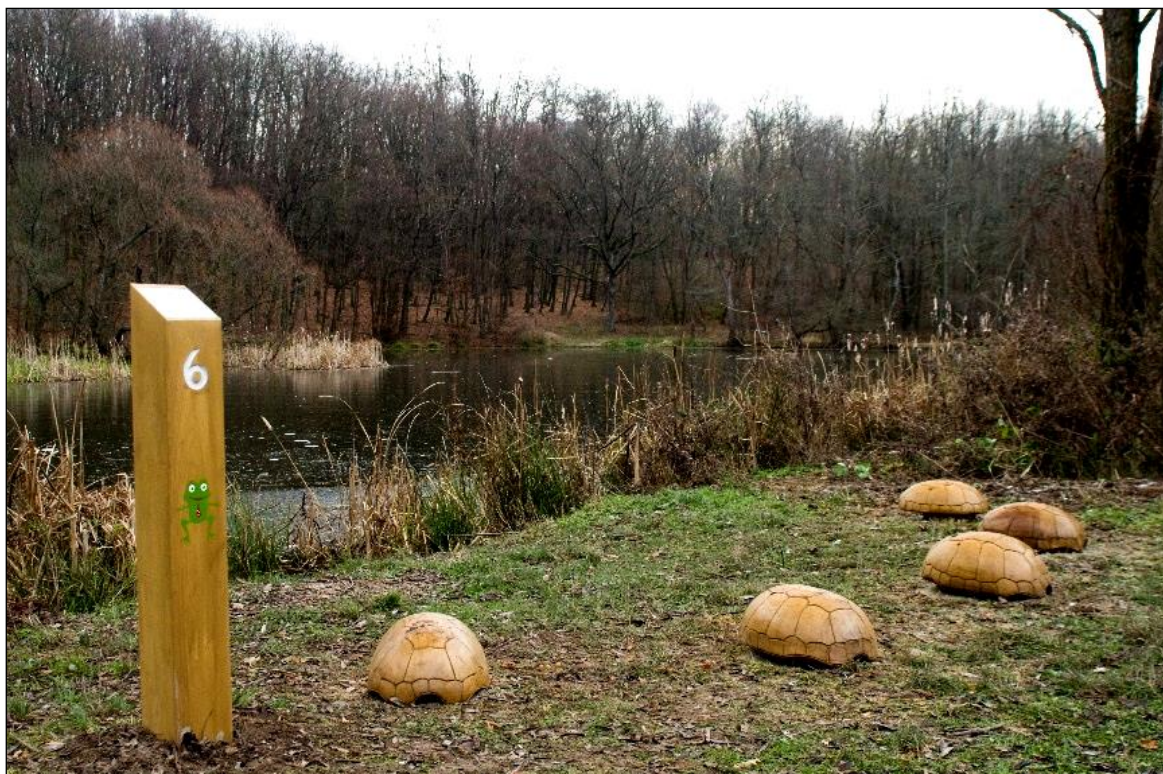
A hely sajátosságaihoz illeszkedő, egyedi megjelenésű környezetarchitektúra elemek fontos részei a természetvédelmi bemutatás infrastruktúrájának