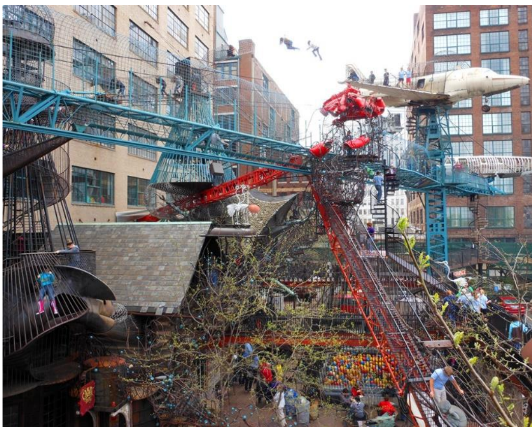
Ipari területekhez, meglévő létesítmények felhasználásával tematikus játszóterek kapcsolhatóak (előkép)

A kerékpározás feltételeinek javítása jelenleg is tervezett, ez további nyomvonalakkal, és kiegészítő létesítményekkel, szolgáltatásokkal bővíthető a jövőben. Ilyen lehetőséget jelent például egy kerékpáros pihenő és interaktív gépipari bemutatóhely az ipari parkkal kooperációban, a volt étterem épületének funkcióváltásával.