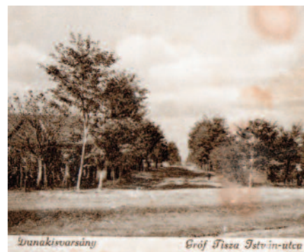
Az egykori Gróf Tisza István utca, ma Széchenyi utca