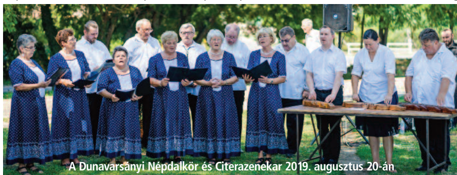
A Dunavarsányi Népdalkör és Citerazenekar 2019. augusztus 20-án