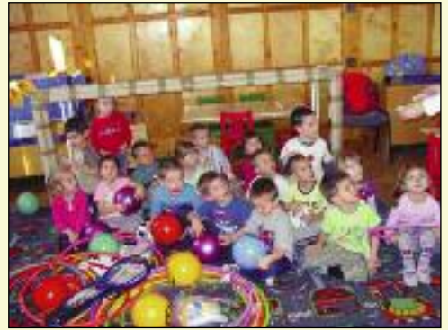
A lelkes szülői gárda segítségével pályázatot nyertünk