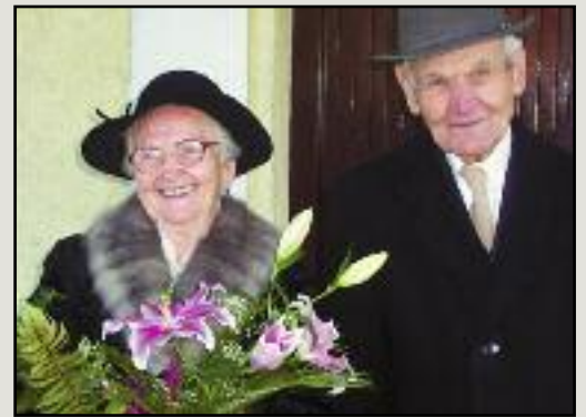
A 2006-os vaslakodalmon

Aktívan részt vettem a Katolikus Egyház életében. Egyháztanácsstag voltam, a Kereszténydemokrata Néppártot vezettem, az 1990-es években hittant tanítottam, valamint irodai feladatokról is elláttam a plébánián.