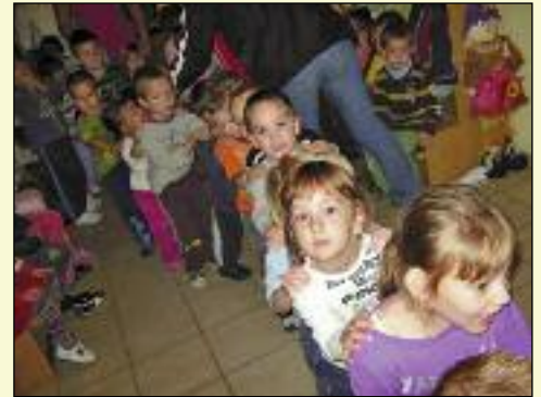
2010 óta ismerjük egymást

Ők is szerveznek programokat, hogy a gyerekek óvodai életét színesítsék