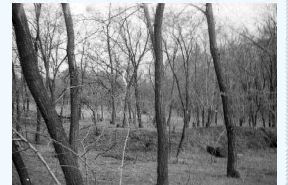
Az Ordási (Kutyakaparási) csárda romjai