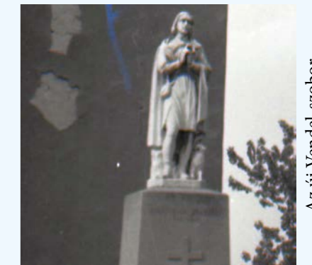
Az új Vendel-szobor