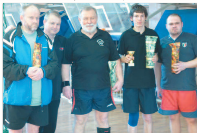
Az első öt helyezett

A sok betegség ellenére tavaly is nagy létszámú nevezés érkezett a 7. asztalitenisz karácsony kupára. Fele-fele arányban voltak igazolt és hobbi játékosok, ahol a csoportmérkőzéseken mindenki mindenkivel összemérhette tudását. A főtáblán és a vigaszágon már kieséses rendszer volt, és az első öt helyezett részesült díjban.