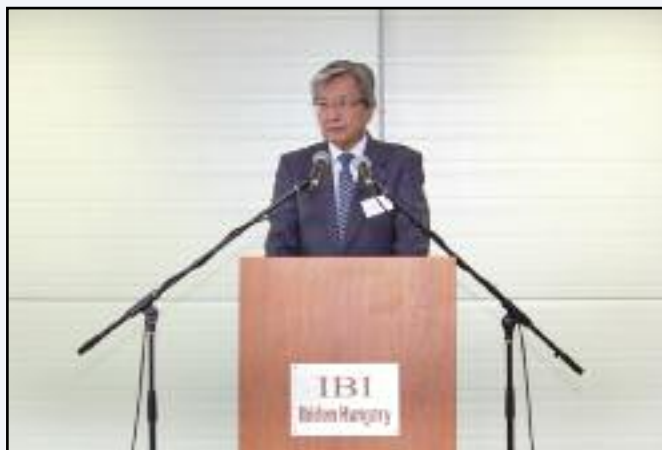
Yamamoto Tadamichi, Japán magyarországi nagykövete

2 013. szeptember 5-én nagyszabású ceremónia keretében került sor a Dunavarsányi Ipari Parkban immáron 9 éve működő IBIDEN Hungary Kft. két új üzemegységének ünnepélyes megnyitójára.