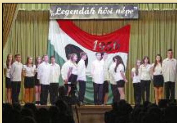
Az Árpád Fejedelem Általános Iskola ünnepi műsora