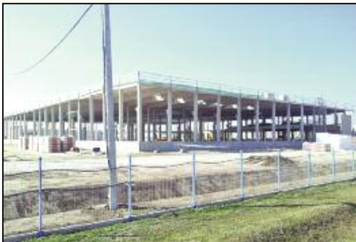
A FémAlk épülőfélben lévő üzemcsarnoka

E gymilliárdos beruházásba kezdett a Dunavarsányi Ipari Park, amely közvetve, az oda betelepült vállalkozások révén eddig is a térség egyik legnagyobb munkahelyteremtője volt, hiszen az autóiparban szinte megkerülhetetlen IBIDEN Kft. négy dunavarsányi üzemcsarnokában megközelítőleg kétezren dolgoznak. A minőségre és a teljesítményre sokat adó, szigorú munkáltató hírében álló japán vállalat honlapján ( www.ibiden.hu ) jelenleg is több szakmában hirdet állásokat.