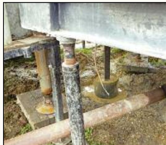
A szennyvíztisztító építése az Ipari Parkban