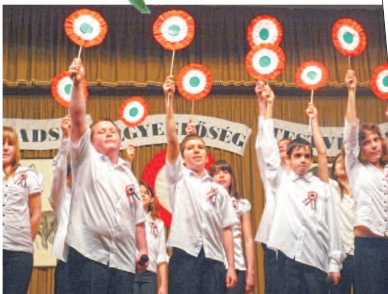
Ünnepi műsor az általános iskolások előadásában