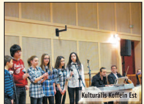
Kulturális Koffein Est

Márciusi Koffein esténket a Multitalent Musical iskola növendékei tették kulturális élményben gazdaggá. Jó volt látni és hallani, hogy mennyi tehetséges gyermek él körülöttünk. Mi sem bizonyítja ezt jobban, mint hogy teltházas volt a rendezvény. Kávé és tea mellett élvezhettük a fiatalok és tanárai előadásában a kellemes dallamokat, a szép verseket és a vidám paródiákat.