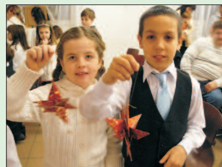
Karácsonyi ünnepség Nagyvarsányon