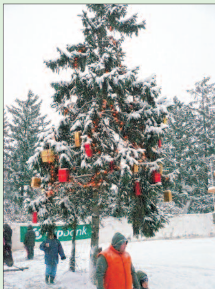
A város karácsonyfája