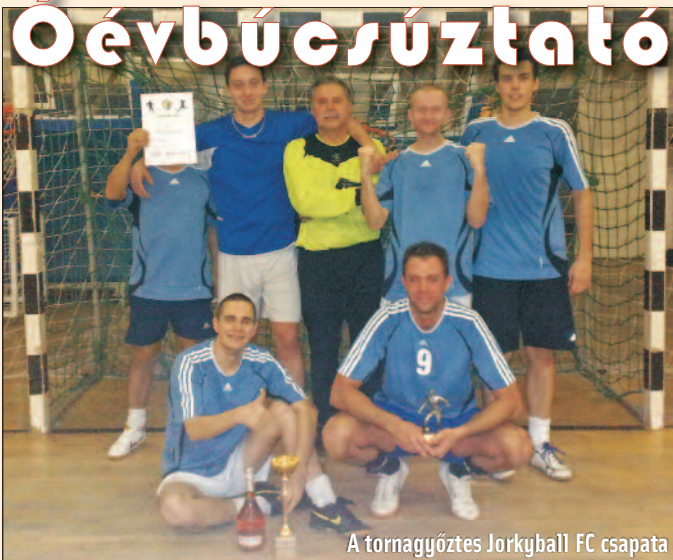
A tornagyőztes Jorkyball FC csapata

Az együtteseket egy 5-ös és egy 4-es csoportba sorsoltuk, ahol a körmérkőzések után a csoportok első két helyezettje jutott az elődöntőbe. (Az egyik csapat sajnos nem érkezett meg, ezért a "B" csoportba csak négy csapatot tudunk sorsolni.) Az "A" csoportból a Royal FC és a Jorkyball FC, a "B" csoportból pedig az Ismeretlen FC és a Délegyháza Öregfiúk jutott tovább. Következhetek az elődöntők, melyek a következőképpen alakultak: Royal FC-Délegyháza Öregfiúk 4:1, Ismeretlen FC-Jorkyball FC 1:2. A két mérkőzés vesztese játszhatott a harmadik helyért: Ismeretlen FC-Délegyháza Öregfiúk 5:2. Ezután a döntő összecsapás jött, ahol a Jorkyball FC csapata visszavághatott a csoportmérkőzésen a Royal FC-től elszenvedett 4:0-ás vereségért. A lelkesen és jól játszó Jorkyball FC két góllal elhúzott, amit a Royal FC nehezen, de kiegyenlített. Maradt a 2:2-es döntetlen, következhetek a büntetők, amit a Jorkyball FC játékosai jobban rúgtak, és megérdemelten nyerték meg a teremlabdarúgó tornát!