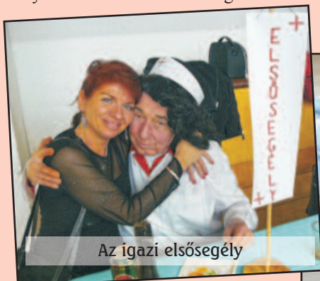
Az igazi elsősegély