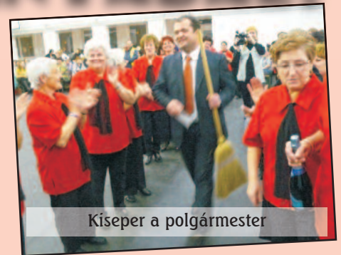
Kíseper a polgármester