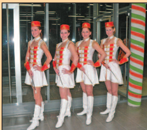
Cikk a 8. oldalon