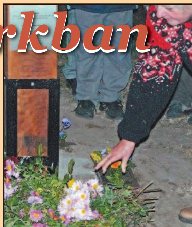
Cikk a 6. oldalon