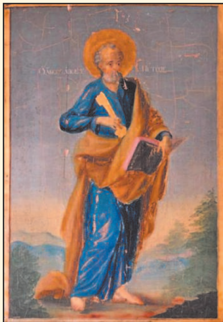
Szent Péter apostol

Az önmagával szemben őszinte hívő ember maga is ráébred olykor, hogy hitének nincs látszata, nincs eredménye, nincs haszna sem a maga, sem a környezete számára. Nem következik belőle sem bátor, sem áldozatos, sem rendes, sem rendkívüli tett. Csak úgy éljük életünket hívőként, mint mások teszik ezt krisztusi hit nélkül. S ennek egyenes következménye nem csak az, hogy terméketlenségünk okán sikertelenek és boldogtalanok is vagyunk, hanem az is, hogy a világ ezt szemünkre veti. Hol van a ti hitetek, kérdezi tőlünk a világ, de kérdezi tőlünk Isten is. Keresi a hitünk tetteit és hitünk termékeit a világ, de Isten is.