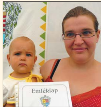
Paláu Klementina Laura