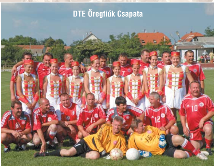
DTE Öregfiúk Csapata