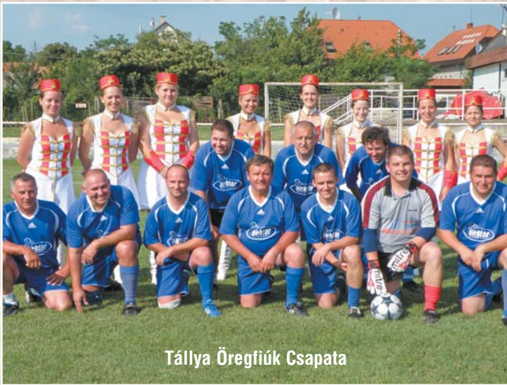
Tállya Öregfiúk Csapata

J ubileumi mérkőzésre gyülekeztek a Dunavarsányi Torna Egylet öregfiúi, hogy megalakulásuk 20. évfordulója alkalmából gálamérkőzést játsszanak Tállya csapatával. A távoli kapcsolat három éve szövődött egy jófajta tokaji bor társaságában. Azóta minden évben összejönnek a fiúk, hol Tállyán, hol Dunavarsányon.