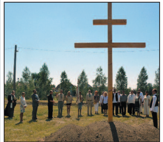
Kettőskereszt-állítás a mézüzem melletti területen

L egfontosabb tárgyaink között tarjuk számon kulcsainkat. Amikor nem találjuk őket a táskánk alján, akkor bosszúsán keresjük. Amikor keresni kell a látogató beengedésekor vagy az otthonból való távozáskor a lakáskulcsot, vagy a gépkocsi kulcsát, akkor érezzük, hogy milyen fontosak ezek a kis tárgyak. De átvitt értelemben is használjuk e kifejezést, nemcsak matematikai tételek, rejtvények megoldásaként, hanem életünk konfliktusainak, feladatainak, legyőzendő kihívásainak megoldásaként is. Sokszor kérdezzük, vajon mi lehet a kulcsa annak, hogy életünk egy-egy nehéz, megpróbáló helyzetéből kikeveredjünk, vagy egy ígéretes helyzetébe bejussunk. Továbbá személyre is alkalmazzuk a kulcs kifejezést, hiszen kulcspozícióban gondoljuk azokat, akik megoldják a bennünket megkötöző bilincseket, feloldják az idegeinket megpróbáló feszültségeket, pótolják/biztosítják a fájdalmas hiányainkat. Ennek alapján gondoljuk arról vagy arról a személyről, hogy kulcspozícióban van, s ezért bizalommal, sőt sokszor alázattal viszonyulunk iránta.