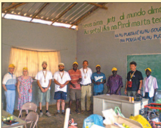
Az adományosztás helyszíne: az ipari iskola

• Szavannákon, dzsungleken kellett keresztül vágniuk. Milyen autóval indultak neki a 8095 km-es távnak?