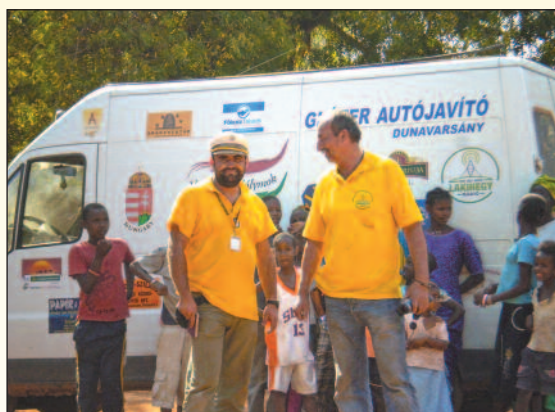
Köszönjük minden támogatóknak a segítségét!