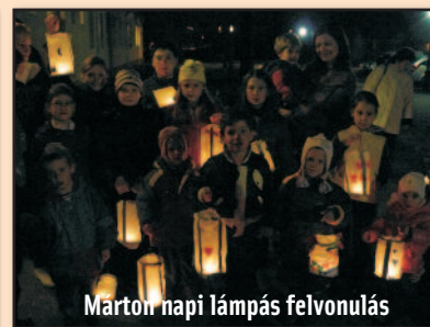
Márton napi lámpás felvonulás