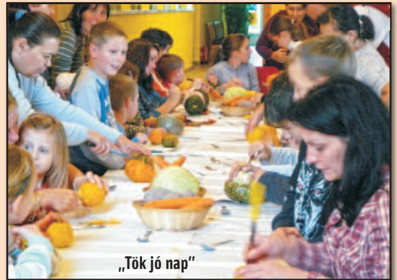
„Tök jó nap”