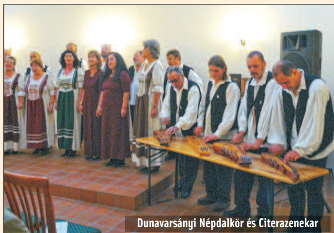
Dunavarsányi Népdalkör és Citerazenekar

Vasárnap délelőtt a Petőfi Művelődési Ház előtti téren Baranta-bemutatót szerveztünk részükre. Itt szintén a gyakorlatban próbálták ki az ostorpattogatást, a nyílvevő használatát és a botozást.