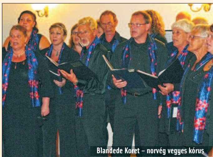
Blandede Koret – norvég vegyes kórus

Szombaton Hollókőre látogattak, ahol megtekintették a várat. Nagyon tetszett nekik a környék, a táj. Az idegenvezető segítségével bemutatóra is sor került, ahol kipróbálhatták a buzogány, nyíl és dárda használatát, sőt, még egy páncélozott inget is felpróbált az egyik kórustag.