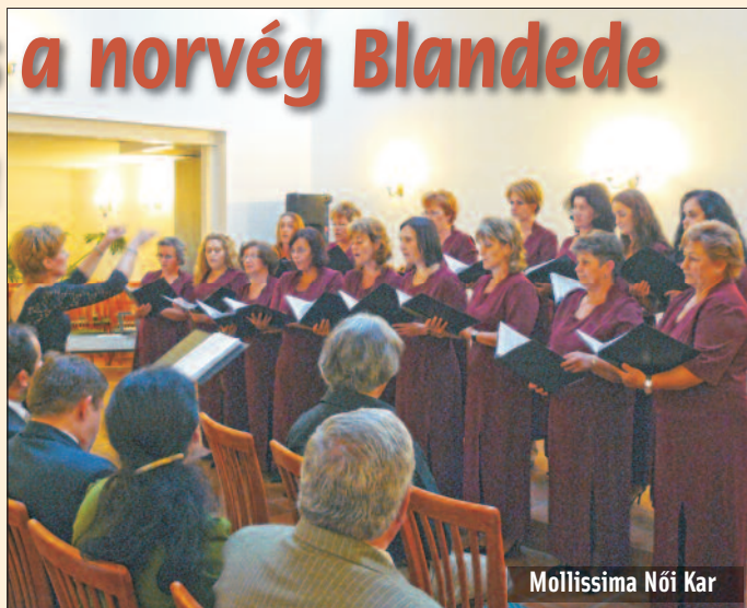
Mollissima Női Kar

A Mollissima Női Kar 2010. szeptember 9-e és 13-a között vendégül látta a két évvel ezelőtt már itt járt 35 fős norvég kórust. Alapos és körültekintő munka előzte meg a vendégfogadást, szeretnénk volna ugyanis számukra tartalmas és színvonalas programot kínálni. A munkából és a szervezésből a kórus minden tagja maximálisan kivette a részét.