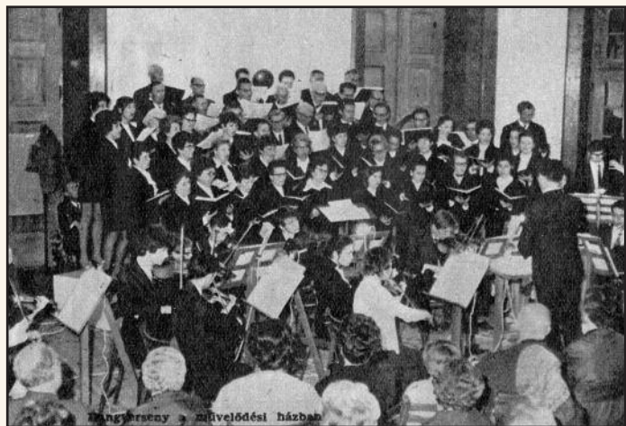
Hangverseny a régi kultúrban

gyerekek nemcsak egyedül játszottak hangszereiken, hanem az együttzenélések alkalmával közösségi élményt is kaptak, ez emelte a kedvüket, és szívesebben köteleződtek el a zene-tanulás mellett – mondja a született zenepedagógus, az egykori hegedűtanár.