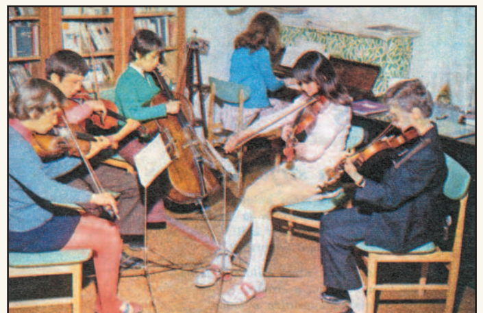
Mikrokozmosz kamaraegyüttes. Ők voltak az utánpótlás Dunavarsányban

A ma már nyugdíjas zenetanár évtizedes áldozatos munkájának köszönhető, hogy a korabeli újságok „Zenélő falu”-ként írtak Dunavarsányról. Nem csoda, hiszen az 1964-ben megalakult Pro Musica felnőtt kamaraegyüttes mellett két ifjúsági kamarazenekar (Mikrokozmosz és Ifjú Zenebarát) is, valamint egy 16 tagú táncsoport is működött, amelyek folyamatos igényes programokkal örvendeztették meg a lakosságot. →